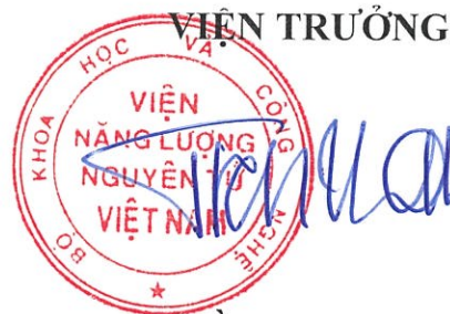
Trần Chí Thành