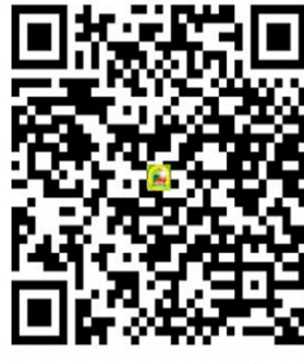
SÁCH TẬP ẢNH 45 NĂM XÂY DỰNG VÀ PHÁT TRIỂN LỰC LƯỢNG