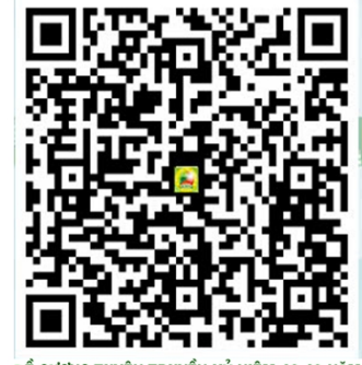
ĐỀ CƯƠNG TUYÊN TRUYỀN KỶ NIỆM 48,49 NĂM XÂY DỰNG VÀ PHÁT TRIỂN LỰC LƯỢNG