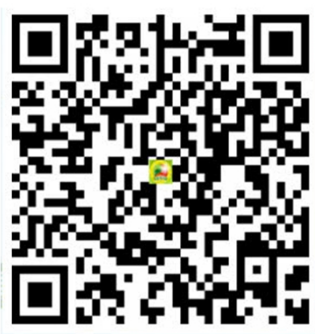
SÁCH LỊCH SỬ LỰC LƯỢNG TNXP THÀNH PHỐ

Hoặc dùng điện thoại thông minh quét mã QR: