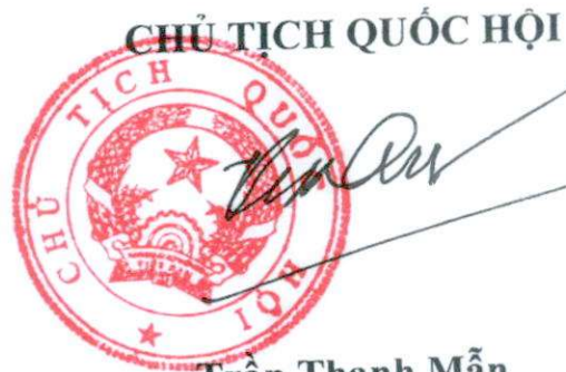
Trần Thanh Mẫn