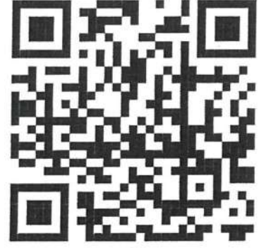
Trường Đại học Công nghệ Thông tin Đại học Quốc gia TP.HCM

Địa chỉ: Khu phố 6, phường Linh Trung, thành phố Thủ Đức, Tp. Hồ Chí Minh