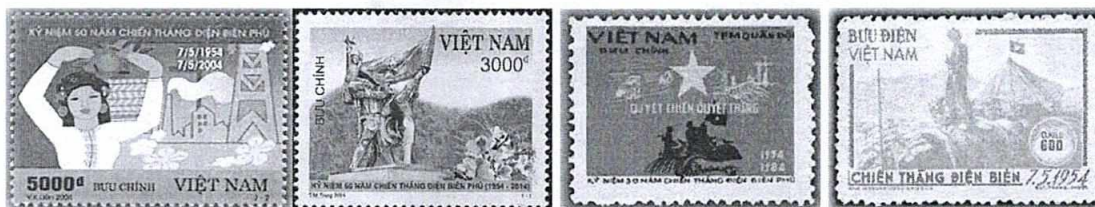
(a) (b) (c) (d)

Câu 1: Vào các năm chẵn kỷ niệm chiến thắng Điện Biên Phủ, Bưu điện Việt Nam có phát hành tem về sự kiện lịch sử này. Em hãy sắp xếp các mẫu tem sau theo trình tự thời gian phát hành.