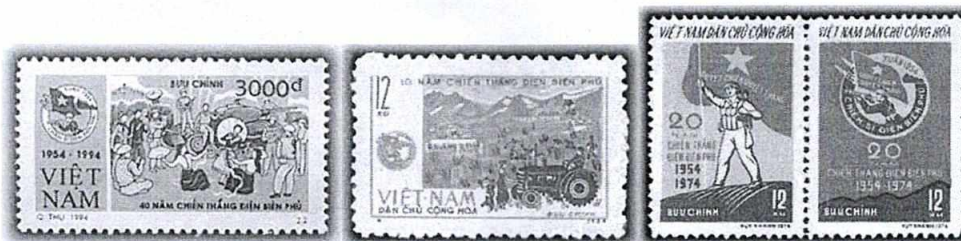
(e) (f) (g)

Câu 2: Trong chiến dịch Điện Biên Phủ có các chỉ huy quân sự xuất sắc đã góp phần to lớn vào thành công của chiến dịch. Em hãy cho biết vài nét về các vị tướng lĩnh quân đội nhân dân Việt Nam được thể hiện qua các mẫu tem dưới đây.